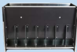
210000010 Foderautomat TF7, dobbelt