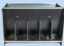
210000006 Foderautomat F5, dobbelt